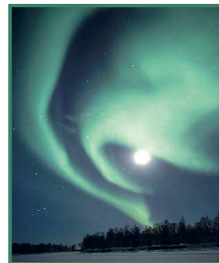
localisation: Kaamanen, Laponie finlandaise

Soirée récréative et culturelle, organisée par la Commission de la bibliothèque Les aurores boréales et australes mercredi 29 mars 2017, à 20 h, à la grande salle, à Lausanne