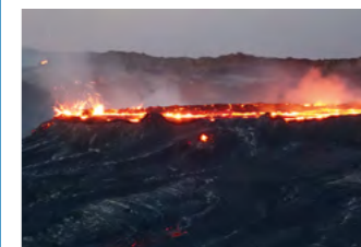
Volcan Erta Alé