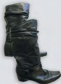
Une paire de bottes pour dame, taille 39