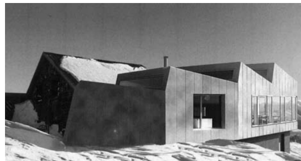
« Le Scaphandre et le papillon » O. Cheseaux - A. Rey

Voici les images des quatre projets éliminés :