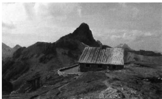
« Compeed » Laurence de Preux