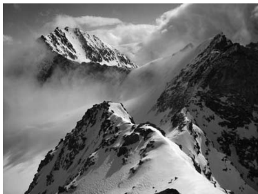
Ci-dessus : 1. Course au Ritord