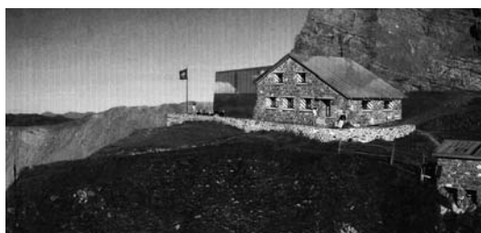
« Quarz » Meyer architecture sàrl

75 e anniversaire de la cabane du Trient: trois ans après l'inauguration du deuxième agrandissement célébré en 2006, il n'y aura pas de festivités cette année. Une délégation du comité montera toutefois à la cabane les samedi 27 et dimanche 28 juin 2009. Chaque clubiste désireux de se joindre à cette escapade est le bienvenu sur inscription préalable!