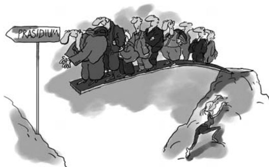
Le tremplin pour la présidence

Etre présidente ou président de section demande un certain nombre de connaissances, aussi bien au niveau de sa propre section que de l'Association centrale du CAS. Expérience de la conduite, talents d'organisation, capacités communicatives et, entre autres, des connaissances en matière d'alpinisme sont autant de conditions requises pour remplir cette fonction. Est-ce trop demander ? Malgré les contacts pris ces dernières années, le comité n'a aucune candidature à proposer... Le poste est ainsi vacant, de sorte qu'un article paraîtra dans le bulletin de mai pour le repourvoir.