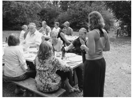
Les « multi » choix...