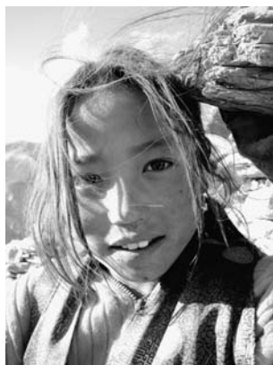
Jeune bergère de yacks