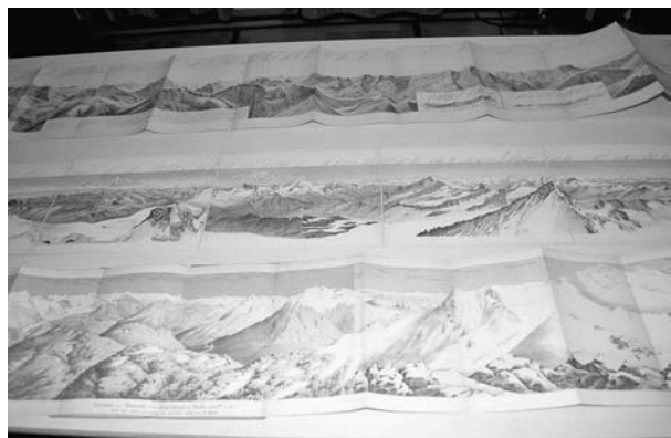
Quelques panoramas conservés à la section

La commission des archives a sélectionné quelques panoramas conservés à la section, ceux de la région lémanique: Montreux, Rochers-de-Naye, rive vaudoise du lac Léman, Diablerets, ou les plus représentatifs: Mont-Rose, Gornergrat, Mont-Blanc, etc. Ces panoramas sont des œuvres d'art: la finesse du trait, la précision du relevé, la qualité du dessin, la multitude des localisations constituent un hommage rendu aussi bien aux artistes qu'aux clubistes, premiers bénéficiaires de cette entreprise.