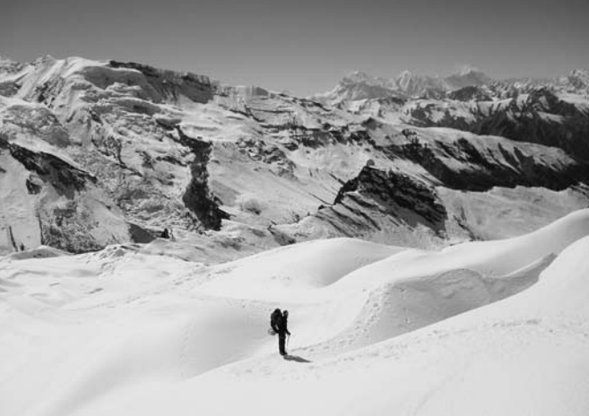
Entre camp I et camp II