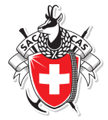
Tête Blanche

Club Alpin Suisse CAS Club Alpino Svizzero Schweizer Alpen-Club Club Alpin Svizzer