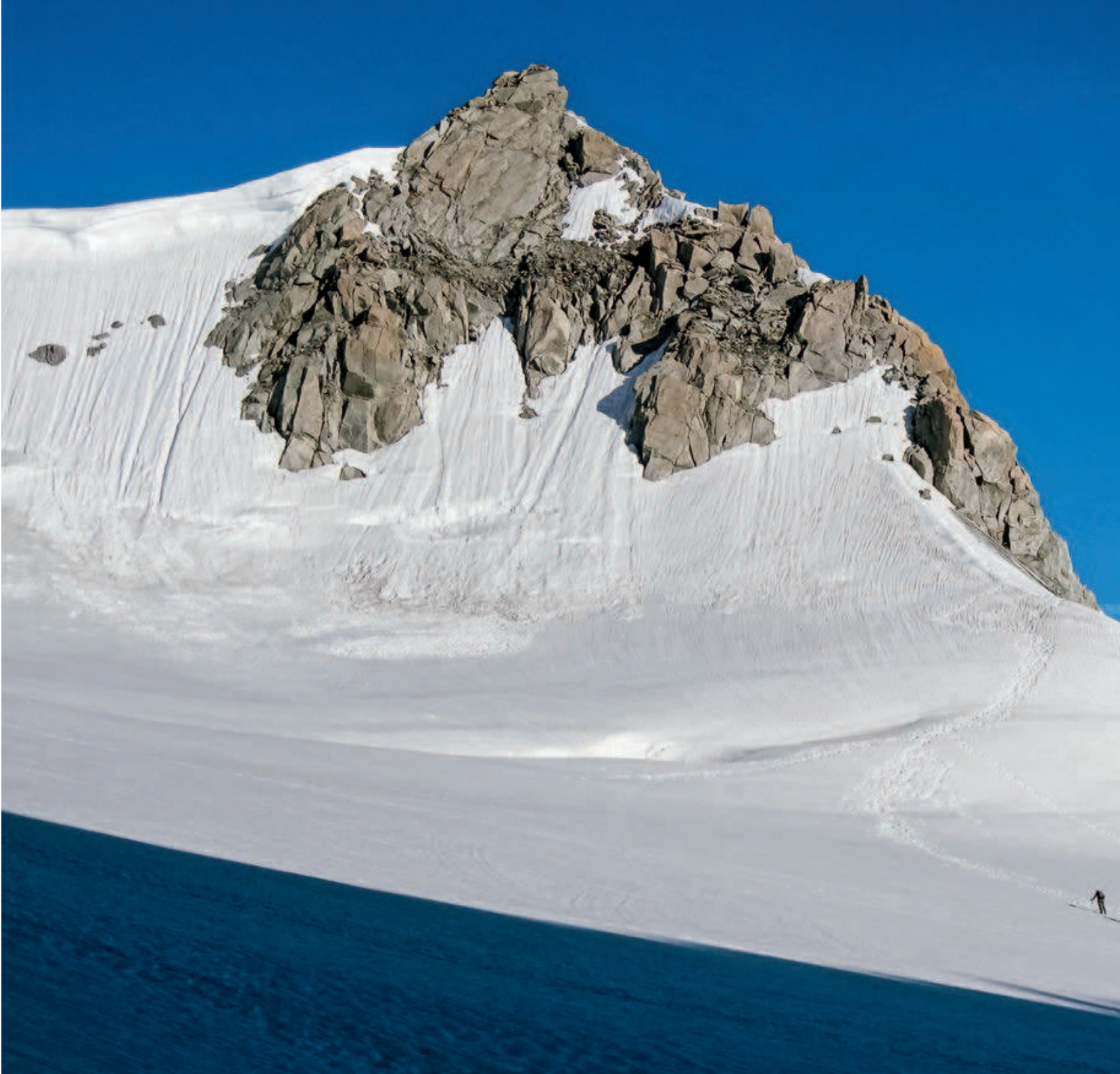
Tête Blanche

Ces Lignes directrices ont été adoptée par l'Assemblée des délégués le 15 juin 2013 à Interlaken.