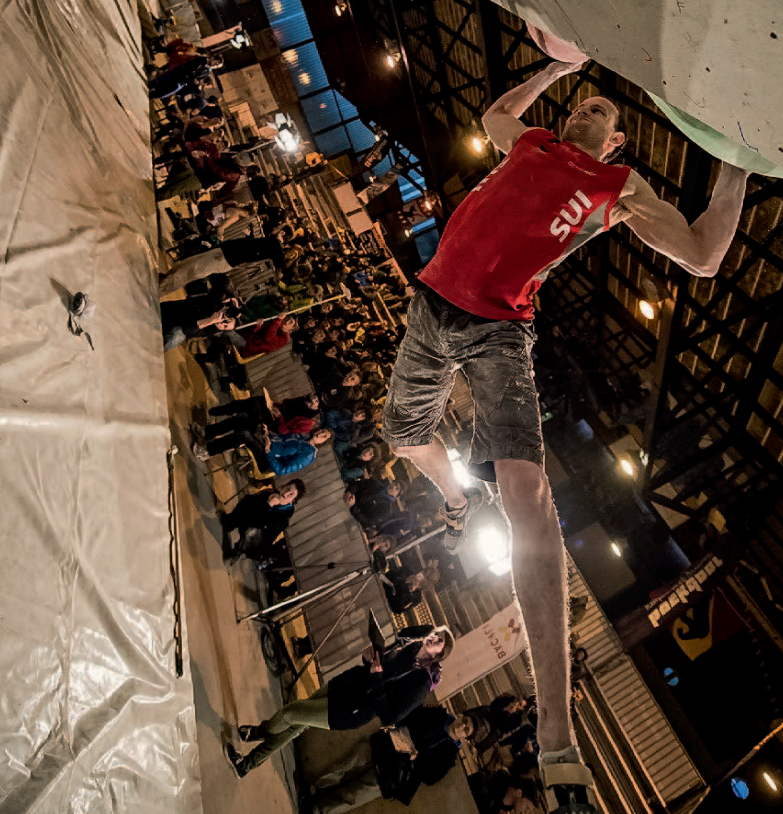
Swiss Climbing Cup Grindelwald