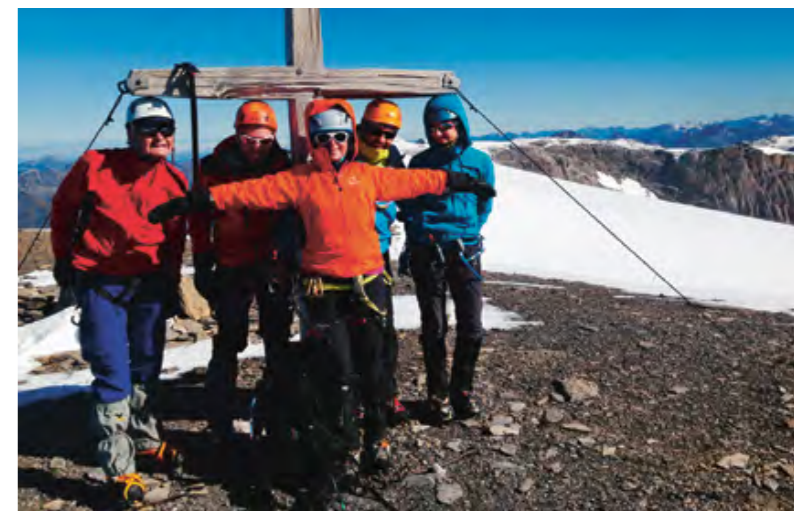
Au sommet officiel du Wildstrubel

panorama à 360 degrés s'ouvre à nos yeux dans une clarté incroyable qui nous permet de détailler tous les sommets des Alpes: Mont-Blanc, Cervin, Pointe-Dufour, Dom des Mischabels compris. Un léger vent frais nous incitera à enfiler nos vestes et nos doudounes. Dans la descente vers le glacier de Plaine-Morte, la neige de l'avant-veille reste mêlée aux cailloux. Nous décidons alors de garder nos crampons. Le désert blanc nous attend, longue traversée sous un soleil de plomb et un ciel imperturbablement bleu.