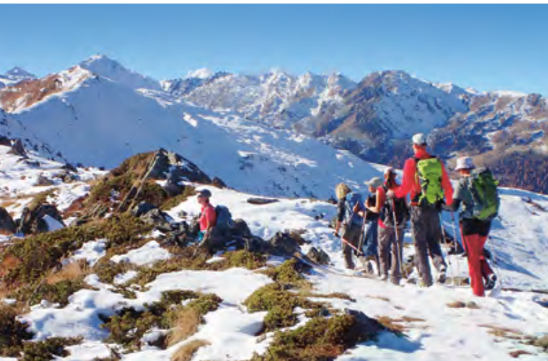
Jusque-là, tout va bien...