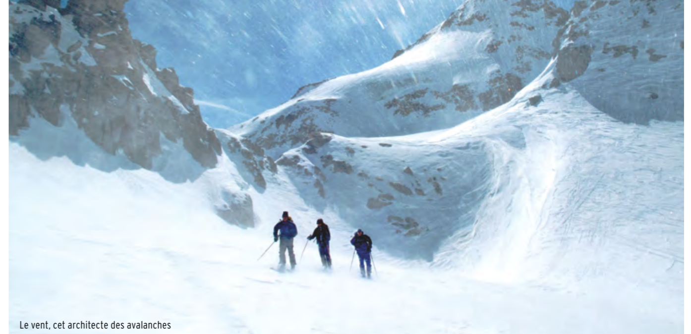
Le vent, cet architecte des avalanches

D'autres personnes rencontrées en route voudraient se greffer sur le groupe initial? Elles risquent de l'influencer, de ralentir sa progression et de modifier la donne. Les remontées mécaniques sont encore fermées? Avez-vous préparé une alternative?