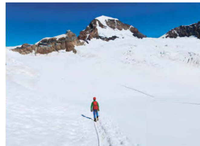
Thomas sur le glacier à la descente de la Jungfrau. Itinéraire facile et peu crevassé, mais neige transformée qui rend le retour peu agréable