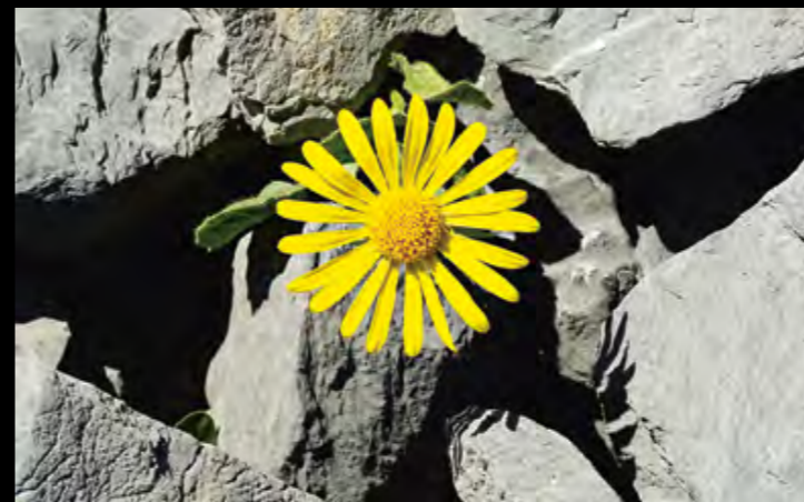
Cabane Rambert - Contraste alpin... f/4.51/640 29.44 mm 80 ISO