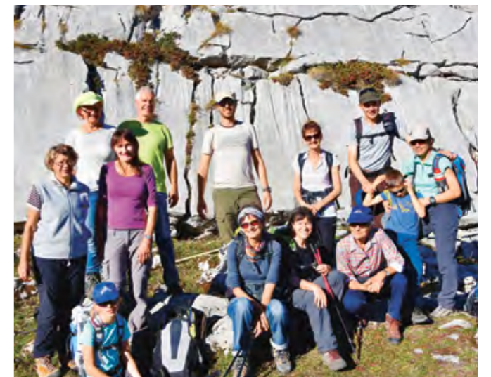
Aux Rochers-de-la-Latte: le sommet est derrière nous, il nous reste à rejoindre le col des Mosses...