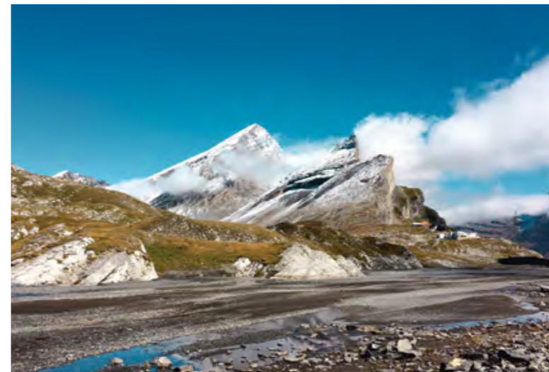
Premières neiges sur le Rinderhorn, en montant à la cabane