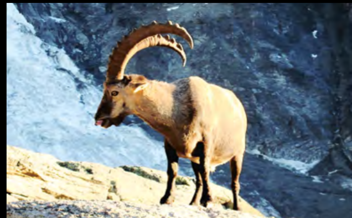
près de la cabane Bordier (VS) - Bouquetin gourmand de sel et de soleil... f/5.51/250 22.8 mm 400 ISO