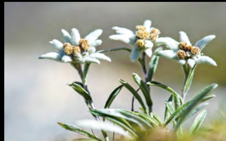
© Olivier Gilliéron, Alpes vaudoises - Edelweiss... f/5.6 1/1600 105 mm 100 ISO