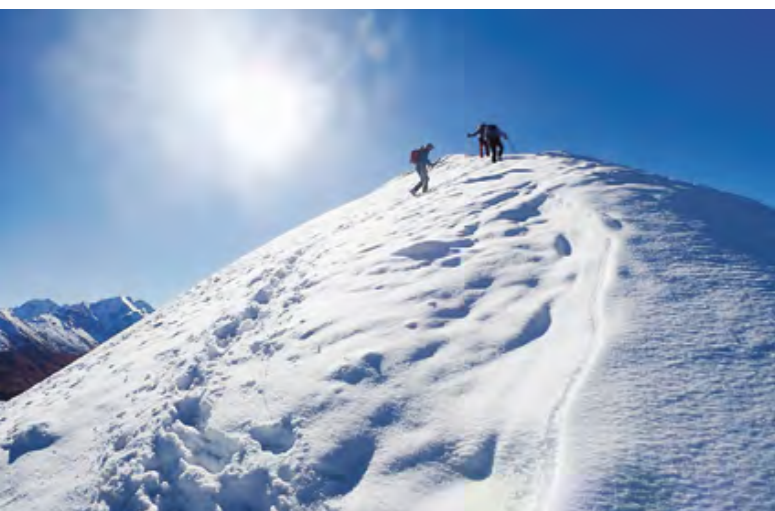
On se croirait dans la face nord de...