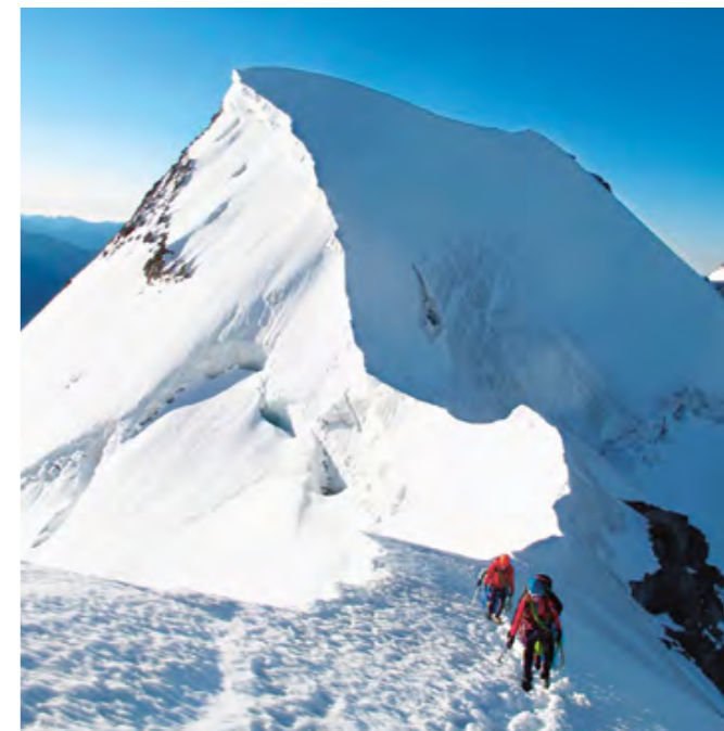
Après un petit raidillon neigeux nous attaquons le ressaut final de la Jungfrau