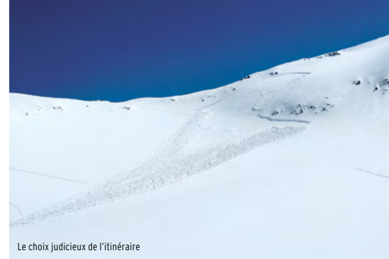
Le choix judicieux de l'itinéraire

vous aurez tendance à en dévier lors de votre propre descente et à aller toucher des endroits plus sensibles. «Nous sommes parfaitement équipés, pas de risques.» N'oubliez pas que «DVA, pelle et sonde» ne sont que des appareils de sauvetage! De même l'airbag ou autre Avalung ne sont que des instruments en cas de catastrophe; ils n'exercent aucun effet préventif. Aborderiez-vous la même pente si vous n'aviez pas ces équipements? «Freeride» «Big Mountain» ou «Big Powder»: tous ces skis larges spécifiques peuvent vous donner une fausse impression de facilité, alors que la neige est devenue compacte ou lourde, donc menaçante. Restez vigilant. «Le froid a consolidé la couche de neige.» Cela n'est valable que lorsque le réchauffement diurne a fait fondre la neige superficielle et que le refroidissement nocturne a pu faire son effet. Dans les