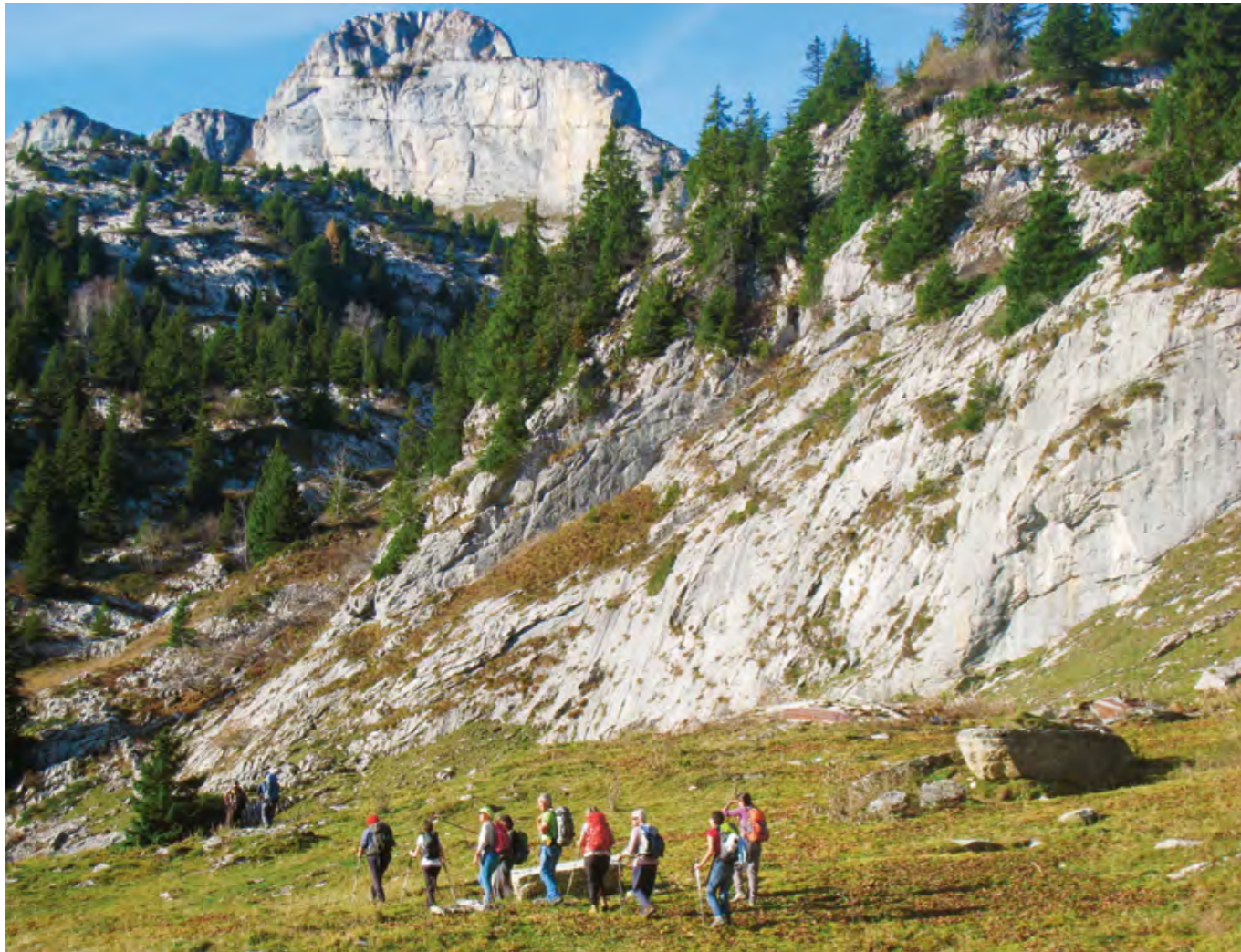
En route vers la Tour-de-Famelon par Château Commun