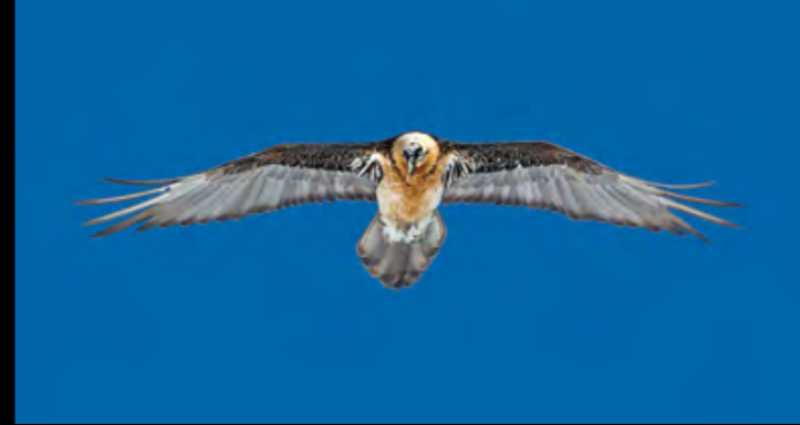
© Olivier Gilliéron - Gypaète majestueux sur les Alpes valaisannes... f/6.31/2500 500 mm 125 ISO