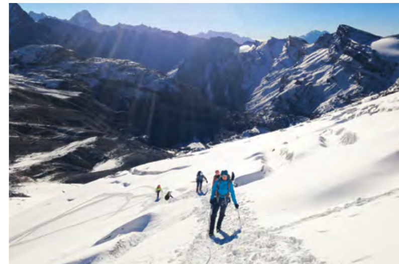
Glacier saupoudré! On serpente entre de grosses crevasses bien ouvertes

Pleins d'énergie... et d'un brin d'hésitation face à la boussole, nous nous offrirons deux sommets du Wildstrubel. Un magnifique