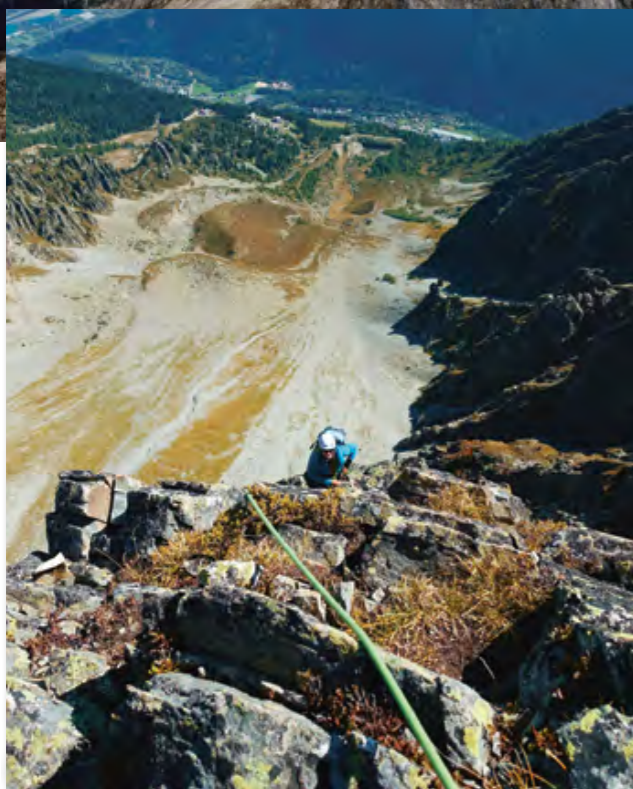
Avant le sommet