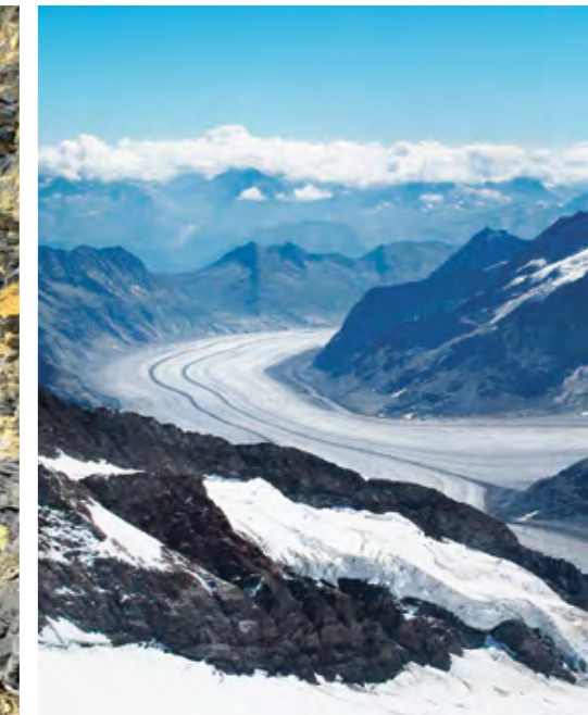
Vue magnifique sur le glacier d'Aletsch