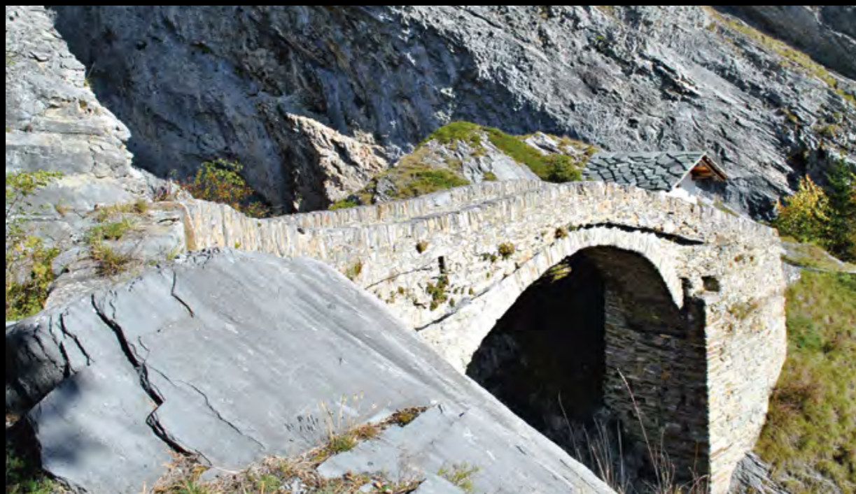
© Bernard Joset, après Erschmatt, nous avons pensé à noter Hohe Brücke sur notre ardoise - Tracé médiéval... f/81/250 18 mm 100 ISO

Robert Pictet, président du Groupe de photographes