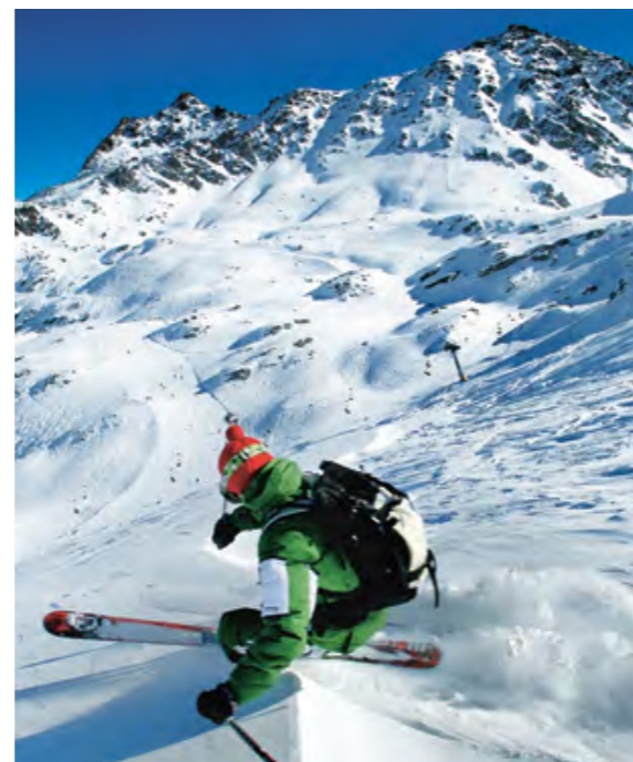
Pas facile de garder la tête sur les épaules au voisinage du domaine skiable

Evident pour le randonneur, un peu moins pour le skieur, une descente ne s'improvise guère au dernier moment, elle se prépare d'avance, sur la carte, dans quelques ouvrages ou sur le web, parfois. Le précepte est difficile au voisinage des domaines skiables où les imprévus peuvent être fréquents. La descente prévue est convoitée par d'autres, qui bousculent le planning et vous mettent sous pression. Il faut beaucoup de discipline, dans la frénésie de l'ouverture des remontées mécaniques, pour appliquer les préceptes d'une approche systématique. Pourtant, chaque skieur sait parfaitement que toute erreur peut lui être fatale, même à deux pas des pistes sécurisées.