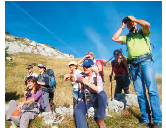
T'en vois combien? Séance d'observation de chamois