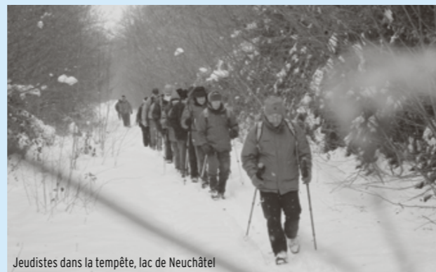
Jeuistes dans la tempête, lac de Neuchâtel

Tous les membres du groupe et les personnes intéressées à la photographie sont cordialement invités à participer à la prochaine assemblée générale, le mercredi 24 février 2016, à 20 h, dans la Grande salle de la section, rue Beau-Séjour 24, à Lausanne