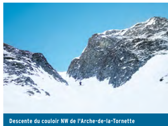
Descente du couloir NW de l'Arche-de-la-Tornette

Sur ces 50 mètres de descente, il n'est pas forcément nécessaire d'enlever les peaux. De cette combe, remonter plein S en négociant au mieux la pente qui se redresse pour gravir la croupe des Millets. Poursuivre par le faux plat en direction du chalet du Leity, puis remonter toute la combe qui se termine à la crête faîtière de Pra-de-Cray et en suivre son arête SW pour atteindre le sommet. La descente du couloir nord n'est pas d'une difficulté extrême, mais tout de même déconseillée à ceux qui sont à plat ventre dans la première plaque de carton. Du sommet de Pra-de-Cray, revenir sur ses pas jusqu'au niveau de l'Arche-de-la-Tornette, où l'on entrevoit l'entrée du couloir. Le départ paraît raide et peu engageant, mais, plus bas, sa pente s'élargit et rassure. De son pied, continuer vers le chalet du «Gros Corbet» à 1506 mètres et celui de «Plan Riond» à 1426 mètres.