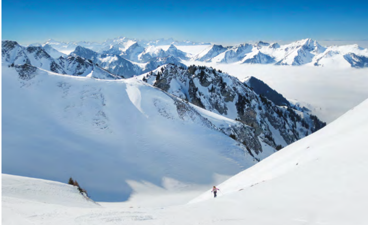
La Combette avant la crête terminale