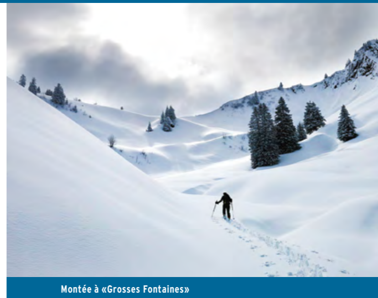
Montée à «Grosses Fontaines»

De là, il est possible de gagner Grandvillard, le plus directement, par le fond de la vallée, en suivant bêtement la route. Solution qui a l'avantage d'un retour rapide. Beaucoup plus «sexy» est le retour via Les Fontaines. Remettre les peaux pour remonter 150 mètres vous récompensera. La descente par les larges clairières est tellement plus belle.