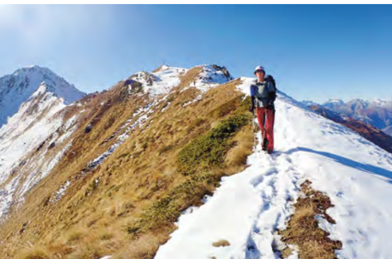
Mais non, on est bien sur la crête..