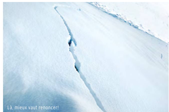
Là, mieux vaut renoncer!

Toute rupture de pente peut induire un changement de conditions qu'il est préférable d'anticiper par un choix judicieux de la trace. En fonction de ces observations, le choix de l'itinéraire de montée ou de descente est primordial. Les combes sont des endroits souvent favorables, mais qui peuvent également être enfouies par des coulées parties sur les pentes situées en dessus. Soyez attentif aux autres pratiquants, évitez les combes ou les dévaloirs situés sous des adeptes de freeride ou laissez-les descendre. Leur observation pourrait vous être salvatrice! N'oubliez pas que votre meilleur matériel de sécurité reste votre cerveau.