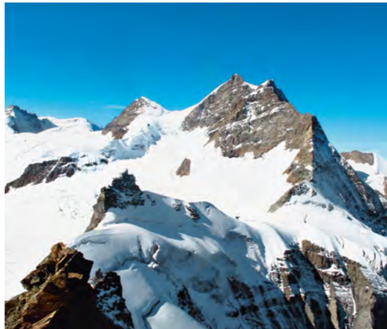
Vue sur la Jungfrau depuis l'arête NO du Mönch