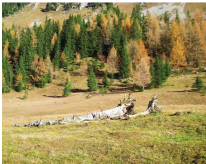
Ambiance d'automne peu après les Anteiennes d'en Haut