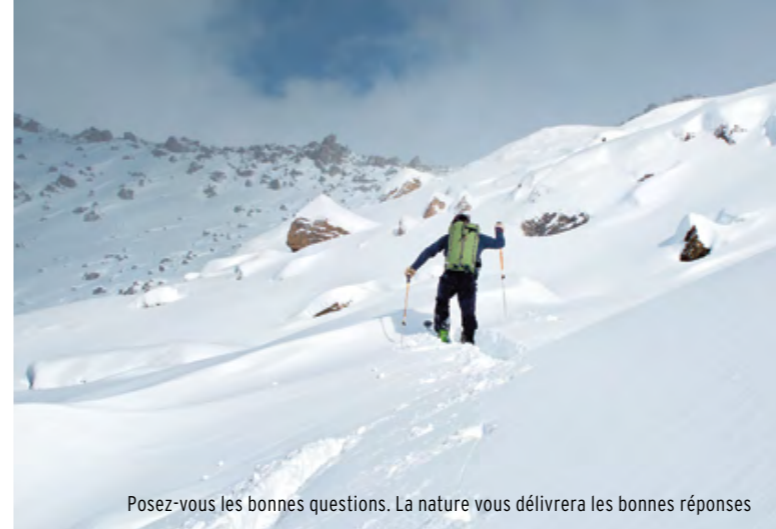
Posez-vous les bonnes questions. La nature vous délivrera les bonnes réponses

«Cette pente est déjà tracée.» Une pente skiée peut donner un faux sentiment de sécurité. Méfiez-vous et restez sur vos gardes! Peut-être, les ouvreurs sont-ils descendus à un moment plus favorable? Il se peut aussi qu'ils aient suivi le seul tracé sûr à sa descente. L'attraction pour les pentes vierges est telle que