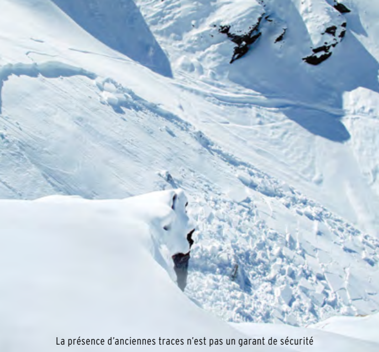
La présence d'anciennes traces n'est pas un garant de sécurité

sont un outil indispensable qui permet d'élargir son champ d'observation. Décelez les pentes de déclinaison et d'exposition semblables à celles que vous voulez parcourir, les traces laissées par le vent qui a transporté la neige. Ne sous-estimez pas l'importance de cet architecte des avalanches. Il peut avoir néigé à peine cinq centimètres, alors que le vent provoquera des accumulations de plus d'un mètre d'épaisseur dans les pentes abritées. Durant la montée, restez attentif aux indices que le manteau neigeux peut dévoiler: consistance, pénétration dans la couche, bruits suspects, éventuels tassements ou probables fissures, réchauffement. Ne vous contentez pas de suivre la trace à la montée, faites votre propre trace pour aborder du terrain vierge. Soyez perspicace, critique et curieux!