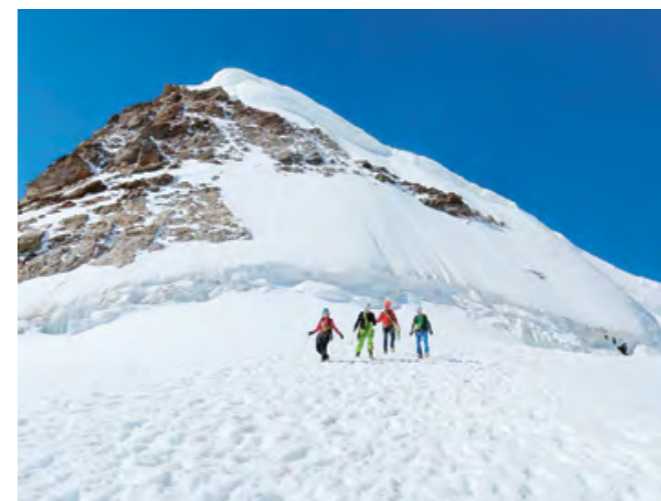
Descente depuis Jungfrau, neige transformée et progression pénible

Environ une heure plus tard, nous passons un pont de neige et il est temps d'enlever temporairement nos crampons pour passer une face rocheuse. L'escalade sera brève. Nous remettons les crampons que nous ne quitterons plus jusqu'à ce même endroit, au retour. La montée se passe sans problème dans une neige assez dure et le lever du soleil nous fait découvrir de superbes couleurs. Nous resterons attentifs pendant une traversée et la montée d'un mur... Le reste sera beaucoup plus simple et, après une nouvelle partie rocheuse, nous serons finalement au sommet vers 9 heures. La vue est superbe, le ciel est bleu, aucun nuage. Notre descente s'annonce chaude... très chaude!