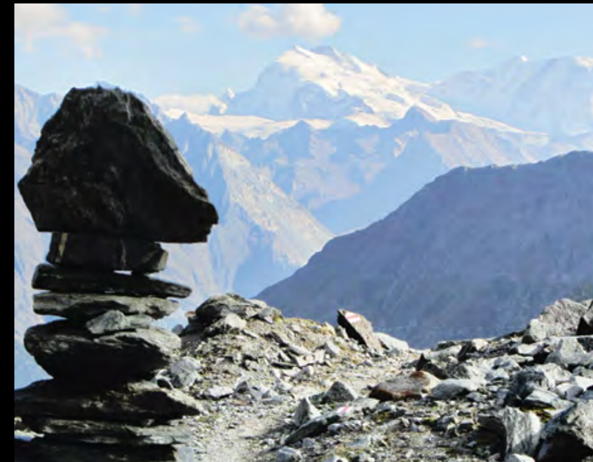
Mont Rose-Lyskam - Atmosphère bouddhique... f/51/640 20.315 mm 100 ISO