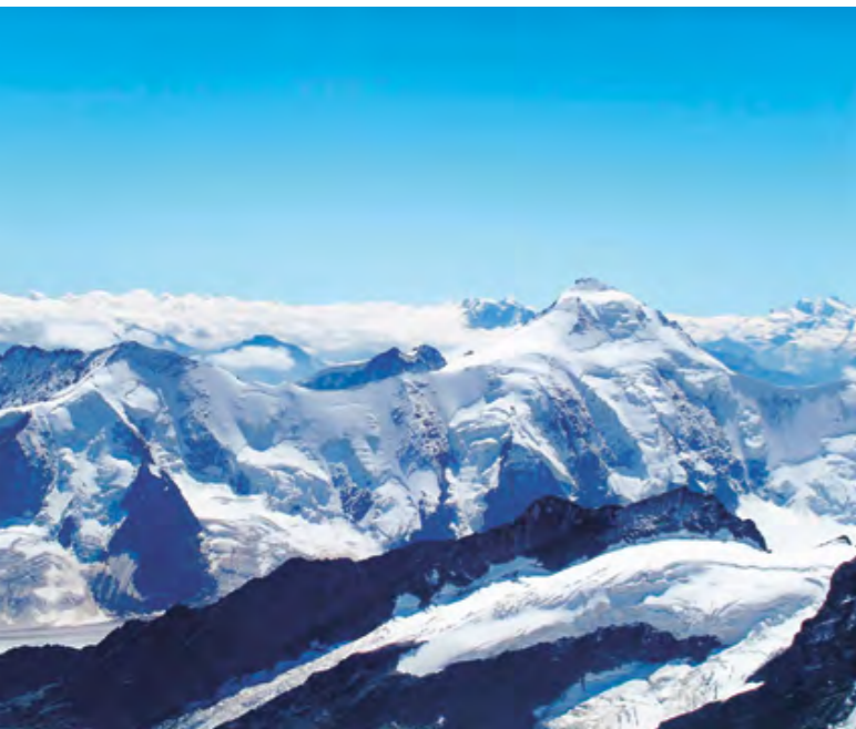
Vue NE depuis le sommet du Mönch