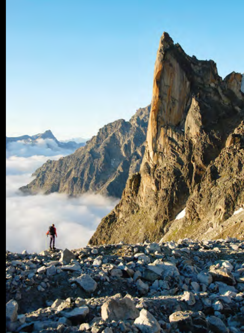
glacier d'Orny face nord du Petit-Clocher-du-Portalet, Valais - Face au défi... f/6.3 1/160 31 mm 100 ISO