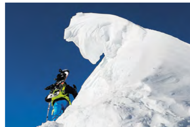
A l'observation des indices naturels, votre meilleur matériel de sécurité est votre cerveau

Evoluer en pleine nature demande une disponibilité totale; il faut être à son affaire, observer et rester sur ses gardes! Pas de musique dans les oreilles! Le casque sur le sac durant la montée! Méfiez-vous si votre esprit est constamment préoccupé par un souci d'une autre origine que le temps, la neige, l'itinéraire ou vos compagnons de route. Le stress que peut induire une situation professionnelle ou privée préoccupante absorbe une énergie qui n'est plus disponible pour l'essentiel. Cela est vrai pour tous les membres du groupe. Vous n'êtes pas dans un stade d'athlétisme et la nature, en tous temps, sortira vainqueur! Inutile de l'aborder avec agressivité, le chronomètre en main, mais avec patience, constance et écoute. Tôt ou tard, elle saura vous gratifier d'un de ces instants magiques qui justifient tout. Et tant pis si ce n'est pas cette fois!