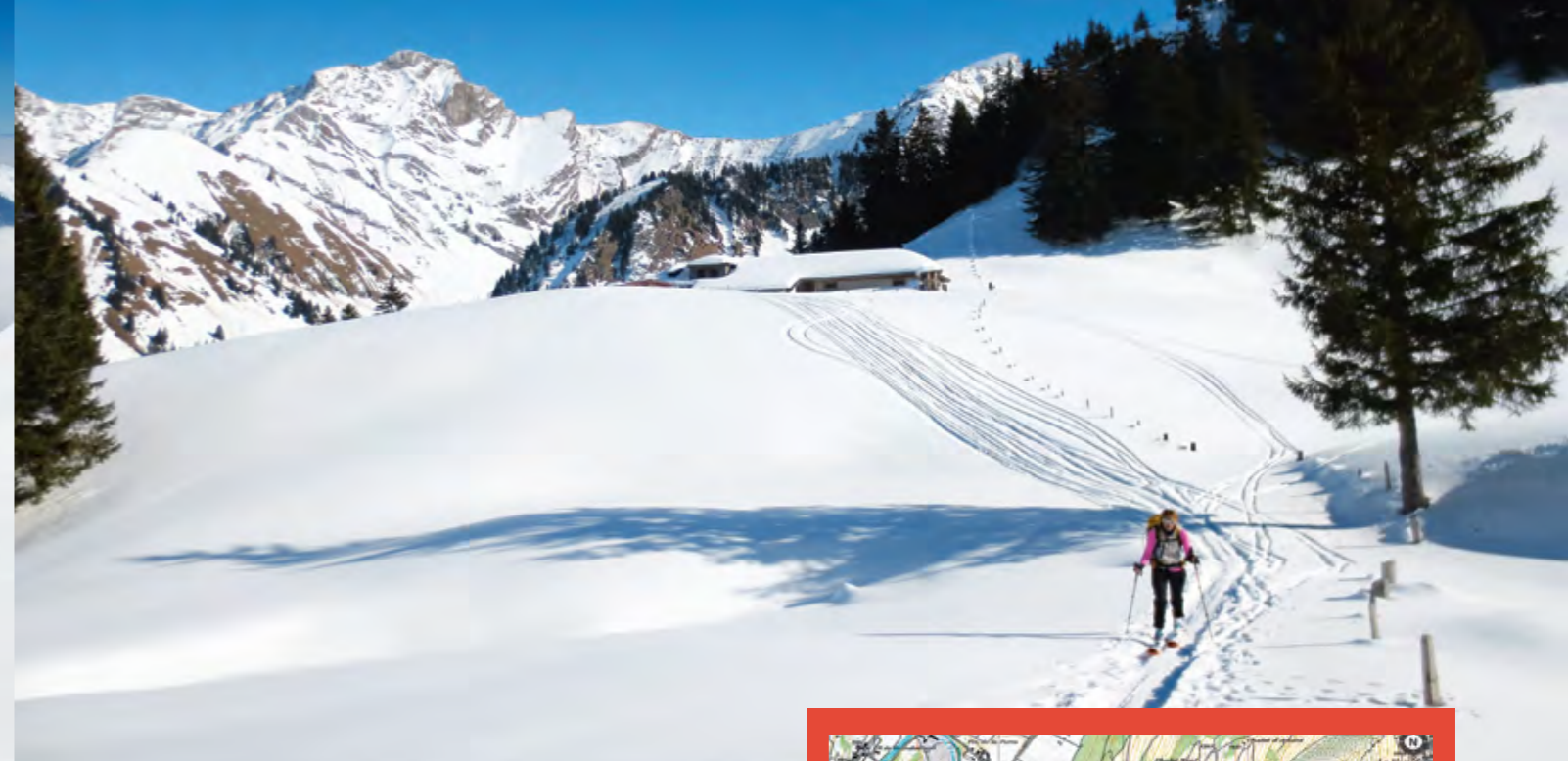
Remontée aux «Fontaines»