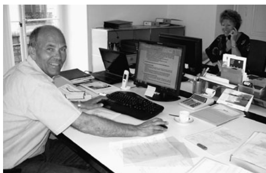
Le secrétariat, lien entre le verbal et l'écrit.