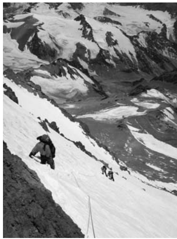
La vue est saisissante

Au bout du glacier, tout en bas, le camp 2