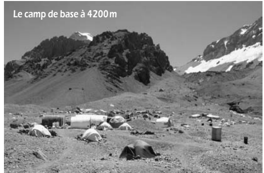
Le camp de base à 4200 m

C'est ainsi que, bien acclimatés, nous sommes arrivés au bout de notre rêve, au sommet de l'Aconcagua 6962 m, par « La directe des Polonais ». Exposition au soleil levant dans la face est, la température est d'environ -5^{\circ} à -10^{\circ} , peut-être un peu plus froid par moments. Les heures s'écoulent sans qu'on s'en aperçoive, tant la vue et le plaisir sont intenses.