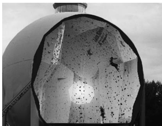
Perspective sur la boule

La nouvelle association, qui compte quelque neuf cents membres, a été constituée le 25 février à Saint-Légier. Elle comprend la commission « Saint-Légier » qui continuera de gérer l'exploitation de la salle de Saint-Légier, ainsi que la commission « Lausanne »