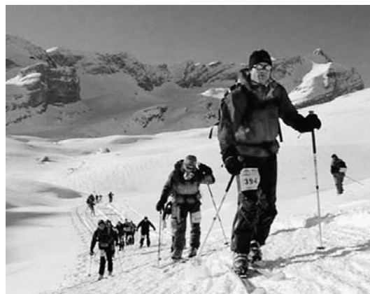
Descente du col des Chamois avec arrivée à la cabane Barraud