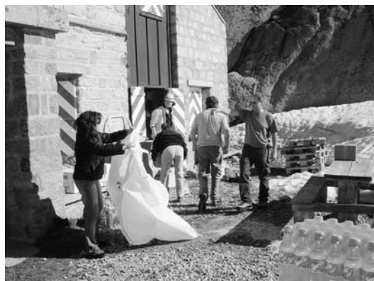
Quelques amis aident à ranger boissons et victuailles

Ovronnaz) sont ouvertes pour la haute saison qui peut ainsi vraiment démarrer. Il invite alpinistes et randonneurs à les découvrir et à y trouver gîte, couvert et boissons, en plus d'un accueil chaleureux.