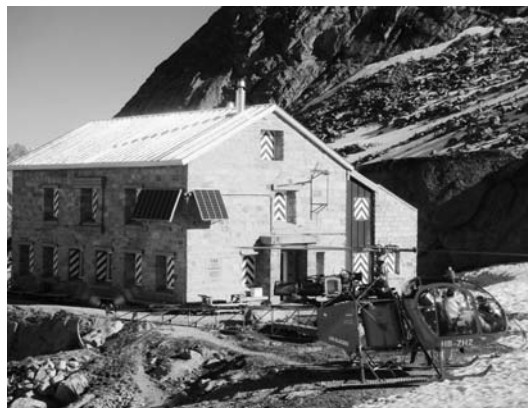
Cabane du Mouttet, 2886 m

Le président informe chacun que les cabanes de la section (A Neuve sur la Fouly, Orny et Trient sur Champex, Mouttet sur Zinal, Rambert sur