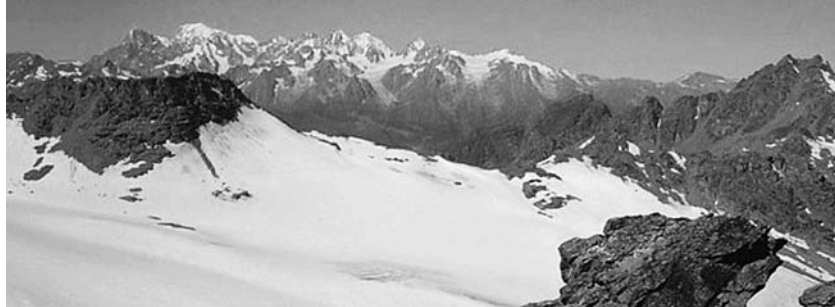
Grand Mont Calme