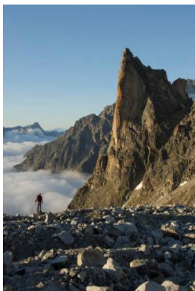
Le Petit Clocher du Portalet

Rappels par la voie, quelque uns sont délicats/pendulaires; recommandé: une corde de 100 m.